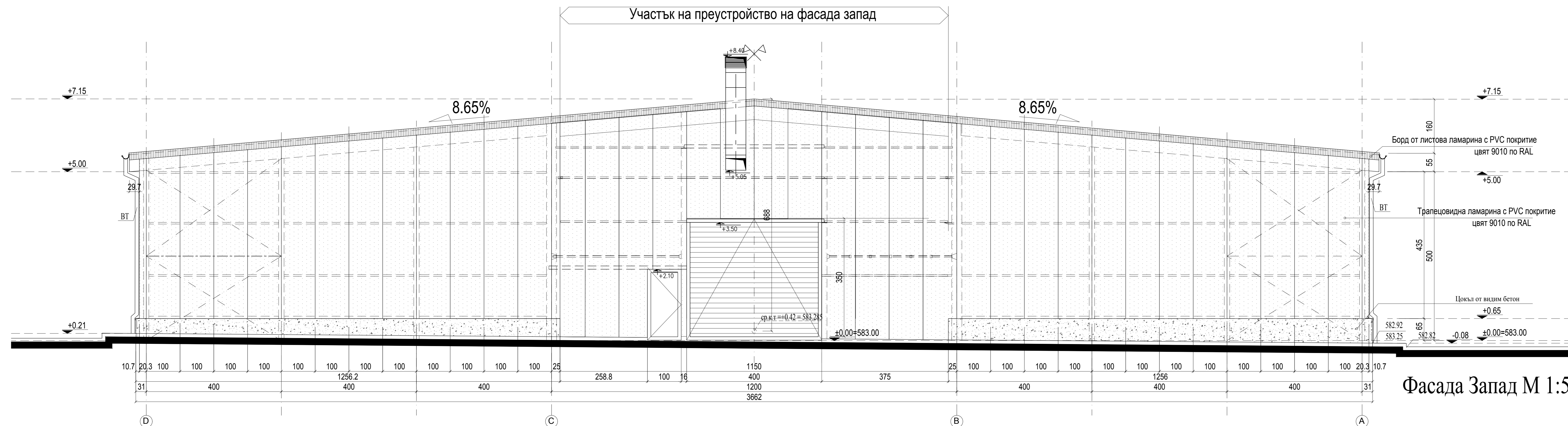
Фасада Запад М 1:50